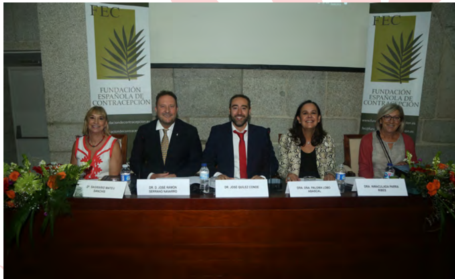
Día Mundial de Anticoncepción 2018.

Puede ver el Acto de Premios 2018 a través de este link: http://fundaciondecontracepcion.es/eventos/dia-mundial-anticoncepcion-2018/