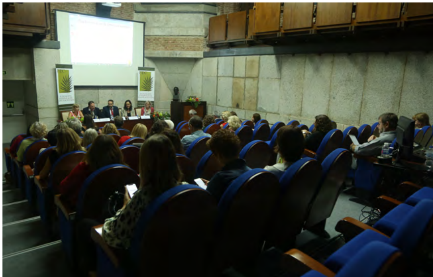
Día Mundial de Anticoncepción 2018.